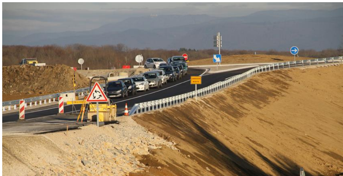
Les travaux sont inscrits au Programme de modernisation du réseau routier national.

Autre préoccupation de l'élu : le nouveau giratoire sur la RN19. « Il est très haut. Les camions risquent de ne pas pouvoir passer quand il y aura de la neige. Ils